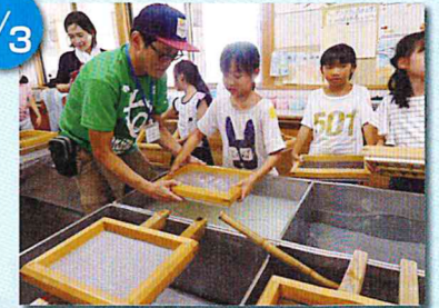
汽車に乗って出かけよう! (紙すき体験)