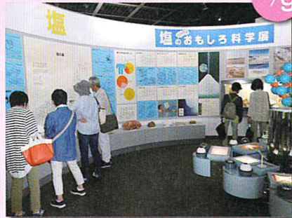
県外研修 (赤穂塩の国)