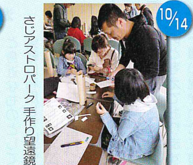
さじアストロパーク 手作り望遠鏡