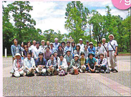
県外研修 (しあわせの村)