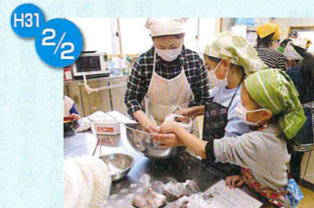
親子でバレンタインのお菓子作り