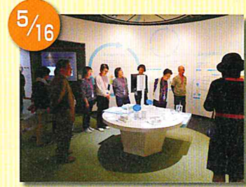
島根原子力発電所