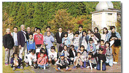
さじアストロパーク

ていですが、観光客でなくても、たまには家族で夜空を見上げて、星を探すのもよいのではと思います。 「新春のついで」では、マジックショー(鳥取大学奇術部)を見た後で、餅つきをしました。昔は各家庭や町内で見られた光景で、私が子どもの頃も年末に親戚が集まって餅をついていたことを思い出します。最近はなかなか身近で餅をつくことがなくなりましたが、子ども達にとつて昔の文化を学ぶことも大切だと思います。お店の餅とは違って、つくたてのお餅の味は格別だったと思います。