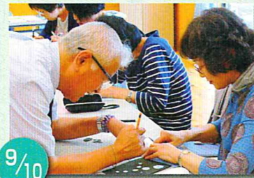
初めての切り絵教室