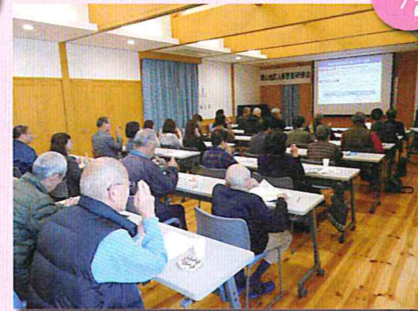
あいサポーター研修会