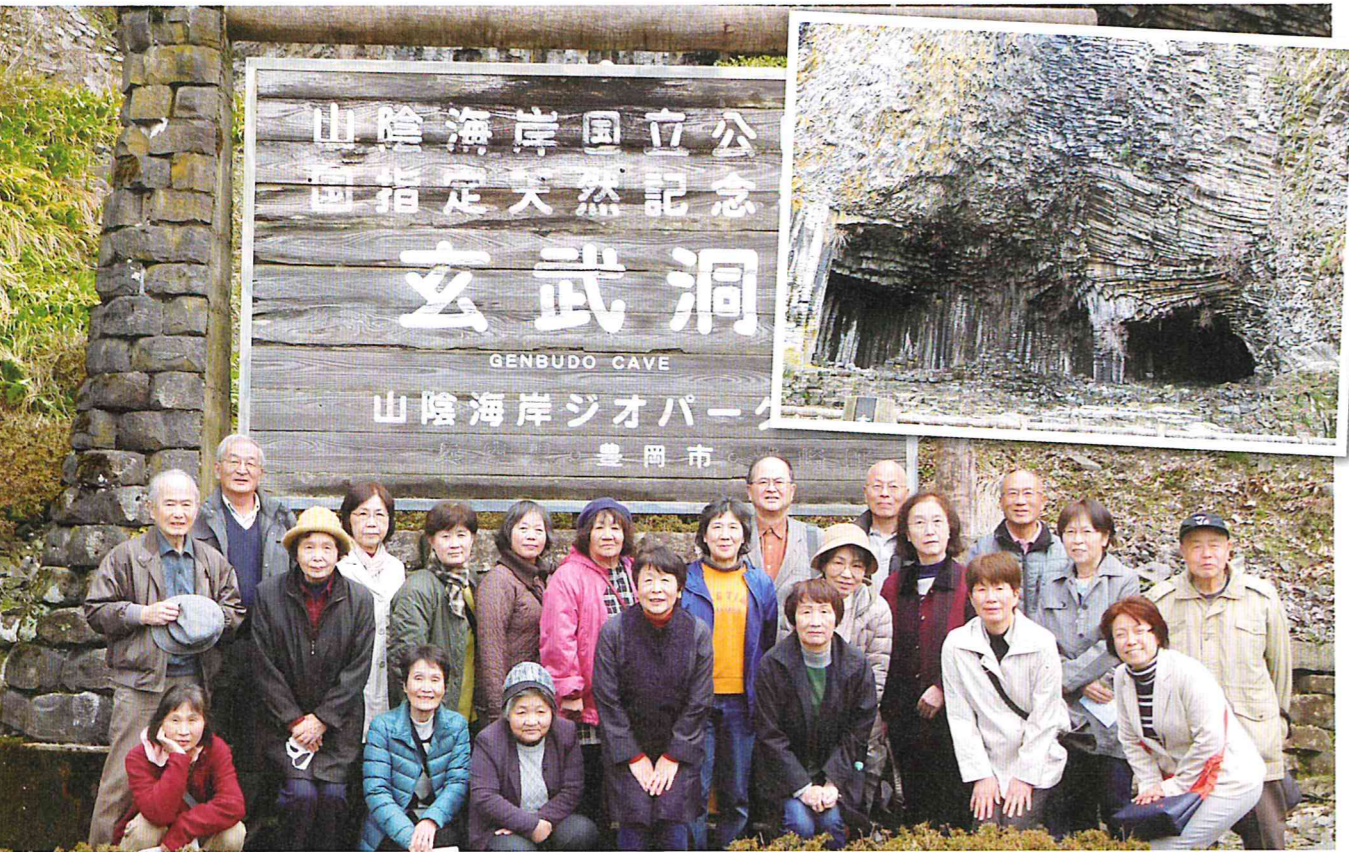
H31.3.12 特色ある公民館活動事業「みんなで学びましょう Part2 ジオパーク編」

自然災害に多く見舞われ、「災」の年といわれた平成三十二年度。幸いにも湖山は大きな被害もなく、当初計画した諸事業は、地区の皆様のおかげでご理解とご支援をいただき、無事に終えることができました。改めて感謝申し上げます。 事業のお知らせをする度に、いつも定員以上の参加申込みがあり、さすが、地区の皆様が、学びやふれあいに對する意欲が旺盛だということ、また公民館活動に関心を持っていただき、支えていただいていることの表れと、とてもありがたく思っております。 また、湖山小学校の三年生が毎年見学に来てくれますが、その中の一人の男児が、夏休みの自由研究の題材に公民館を取り上げてくれて、まとめてくれました。その作品は、鳥取市の作品展に出展されたとのこと、子どもたちが公民館に對して、興味や関心を持ってきてくれたといううれしいかぎりです。