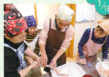
ウイナー作り体験